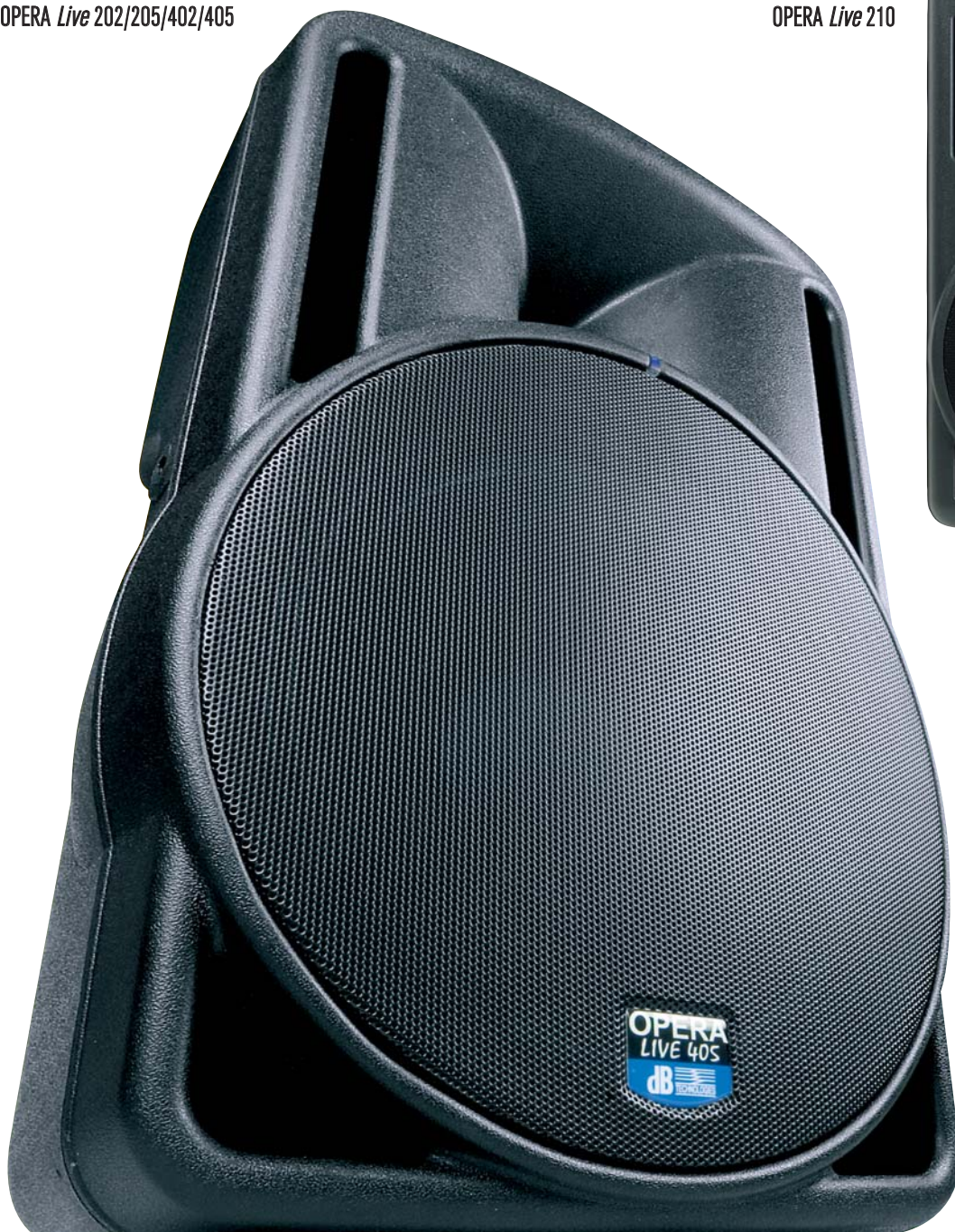
OPERA Live 210