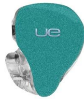
MOSS GREEN SPARKLE