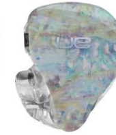
MOTHER OF PEARL