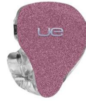
BUBBLE GUM PINK SPARKLE