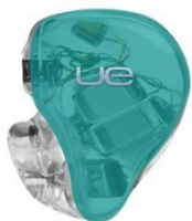
MOSS GREEN TRANSLUCENT