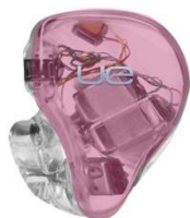
BUBBLE GUM PINK TRANSLUCENT