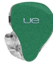
EMERALD GREEN SPARKLE