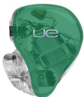
EMERALD GREEN TRANSLUCENT