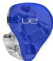
ROYAL BLUE TRANSLUCENT