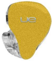
BRIGHT YELLOW SPARKLE