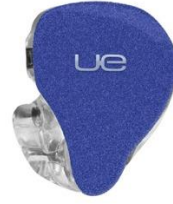
KING BLUE SPARKLE