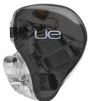
JET BLACK TRANSLUCENT