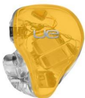
GOLDEN YELLOW TRANSLUCENT