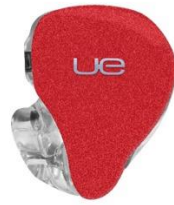
LUCKY RED SPARKLE