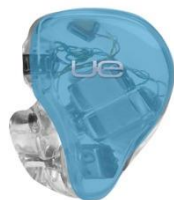
SKY BLUE TRANSLUCENT