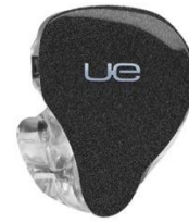
JET BLACK SPARKLE