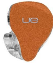
ORANGE RUST SPARKLE