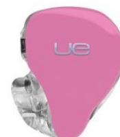
BUBBLE GUM PINK