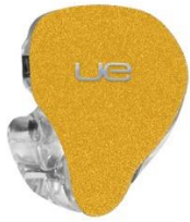
GOLDEN YELLOW SPARKLE