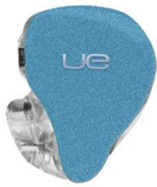
SKY BLUE SPARKLE