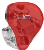
LUCKY RED TRANSLUCENT