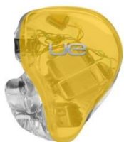
BRIGHT YELLOW TRANSLUCENT