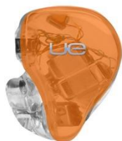
CITRUS ORANGE TRANSLUCENT